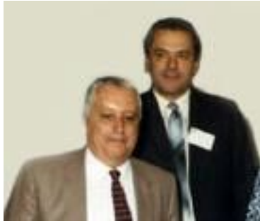
Ilya Prigogine e Stan Grof

A segunda tentativa pioneira de integrar a psicologia transpessoal, dentro de uma nova visão compreensiva de mundo, tem sido o trabalho de Ervin Laszlo, o teórico de sistemas mais famoso do mundo, cientista interdisciplinar e filósofo de origem húngara, atualmente vivendo na Itália. Um indivíduo com interesses de amplitude multifacetada e talentos remanescentes das grandes figuras da Renascença, Laszlo adquiriu fama internacional, como um menino prodígio e pianista de concerto, em sua adolescência. Ele, então, se voltou para a ciência e a filosofia, poucos anos depois, iniciando a pesquisa de sua vida, para a compreensão da natureza humana e da natureza da realidade. Onde Wilber delineou o que deveria ser uma teoria integral de tudo, Laszlo na realidade criou uma (Laszlo 1993, 1995, 2004, Laszlo and Abraham 2004).