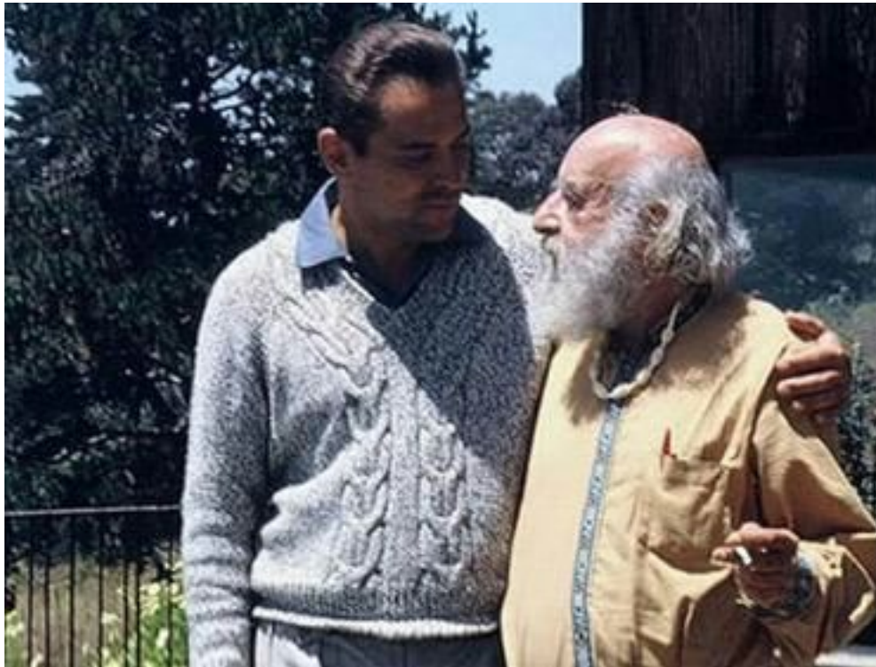
Stan Grof e Fritz Perls