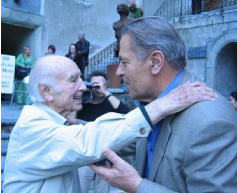
Albert Hofmann e Stan Grof