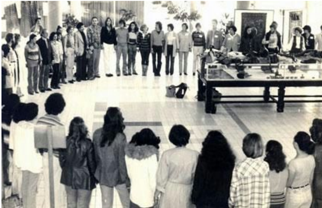
Conferência da ITA em 1978, no Brasil

Desde seu princípio, no final da década de 1960, a Association of Transpersonal Psychology (ATP) realizou conferências anuais regulares em Asilomar, CA. Como o interesse no movimento crescia e estendia além da área de Baía de São Francisco e exterior dos Estados Unidos, reuniões internacionais ocasionais de transpessoal foram organizadas, em várias partes do mundo. As duas primeiras aconteceram em Bifrost, Islândia, a terceira em Inari, Finlândia, e a quarta em Belo Horizonte, Brasil. Na ocasião da reunião brasileira, estas conferências eram tão populares e bem assistidas que foi decidida a formalização da criação de uma instituição que as organizaria, a International Transpersonal Association (ITA). A ITA foi lançada por Stanislav Grof, que se tornou o seu presidente fundador, acompanhado por Michael Murphy e Richard Price; os últimos dois deram início, no início da década de 1960, ao Instituto de Esalen, em Big Sur, Califórnia, o primeiro centro de potencial humano.