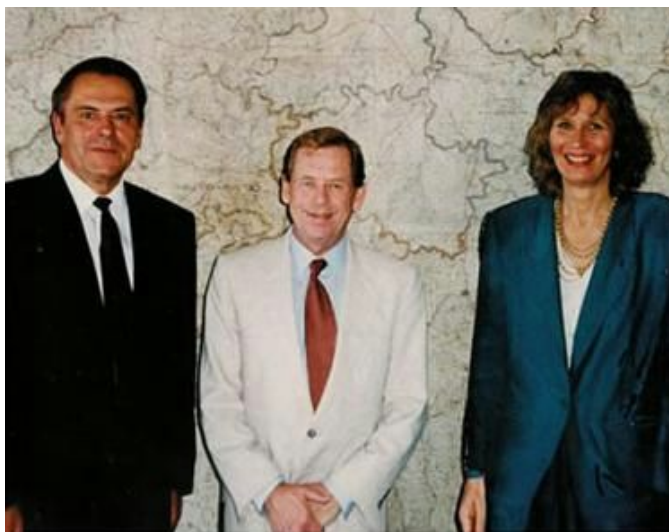
Stan Grof, Václav Havel e Christina Grof.