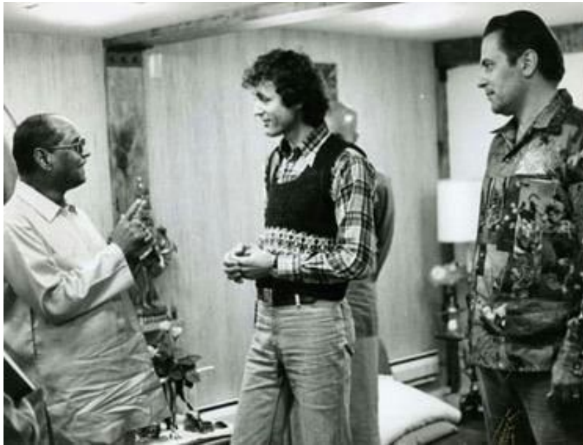
Swami Muktananda, Fritjof Capra e Stan Grof

O mesmo é verdadeiro para a teoria da ressonância mórfica e dos campos morfogenéticos do biólogo Rupert Sheldrake, demonstrando a importância dos campos não-físicos para a compreensão da forma, da genética e da hereditariedade, da ordem, do significado e do processo do conhecimento. Contribuições adicionais excitantes foram a brilhante síntese de Gregory Bateson da cibernética, a teoria da informação e dos sistemas, a lógica, a psicologia e outras disciplinas (Bateson 1979), os estudos das estruturas dissipativas e a ordem fora do caos de Ilya Prigogine (Prigogine 1980, Prigogine e Stengers 1984), a teoria do caos em si (Glieck 1988), o princípio antrópico em astrofísica (Barrow e Tipler 1986) e muitos outros.