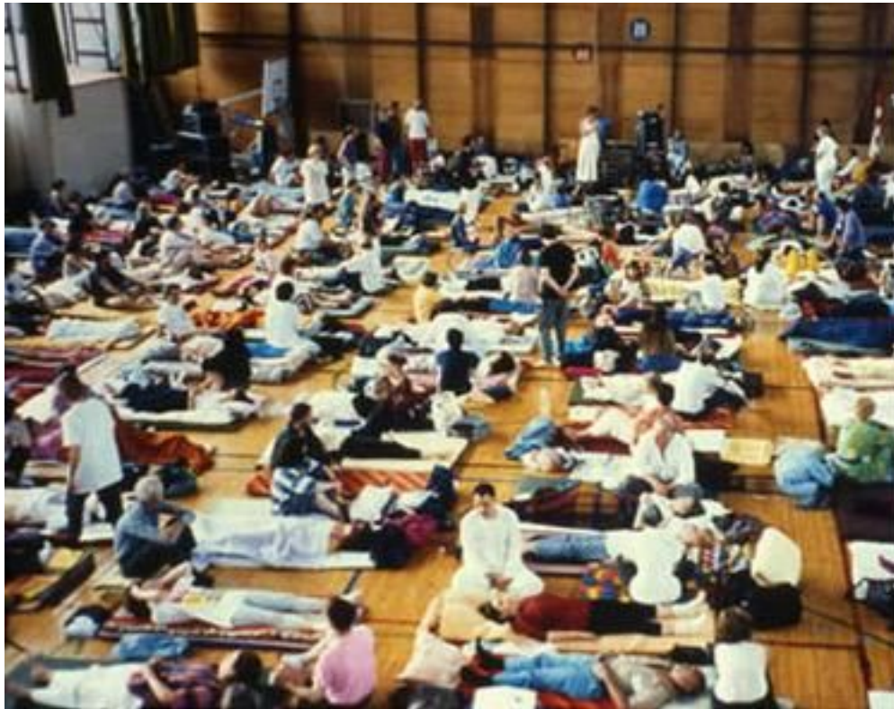
Conferência da ITA em Praga | Sessão de Respiração Holotrópica

Em comparação com a Association of Transpersonal Psychology, a ITA era explicitamente internacional e interdisciplinar. Naquela época, a orientação transpessoal tinha aparecido em muitos ramos de ciência e outras áreas de esforço humano. Então o programa das conferências de ITA não incluía somente psicólogos, psiquiatras e psicoterapeutas, mas, também, físicos, biólogos, antropólogos, médicos, mitólogos, filósofos, matemáticos, artistas, professores espirituais, educadores, políticos, economistas, e muitos outros. A ITA realizou suas conferências em Boston, Massachusetts; Melbourne, Austrália; Bombay, Índia; Davos, Suíça; Kyoto, Japão; Santa Rosa, Califórnia; Eugene, Oregon; Praga, Tchecoslováquia; Killarney, Irlanda; Santa Clara, CA; Manaus, Brasil, e Palm Springs, CA, EUA. Como a lista seguinte indica, entre os apresentadores foram muitos os representantes destacados da vida política, cultural e científica.